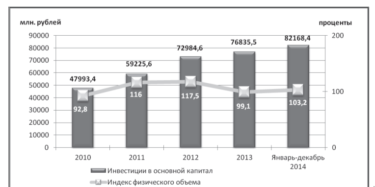
Инвестиции в основной капитал и индекс физического объема инвестиций в основной капитал (млн рублей; в % к предыдущему году)

По индексу физического объема инвестиций в основной капитал в январе - декабре 2014 года к 2013 году Ульяновская область среди регионов Приволжского федерального округа занимает 5-е место. Инвестиции в основной капитал в расчете на душу населения в области составили 64,6 тыс. рублей (9-е место); наибольшее значение - в Республике Татарстан (141,1), наименьшее - в Кировской области (45,6 тыс. рублей).